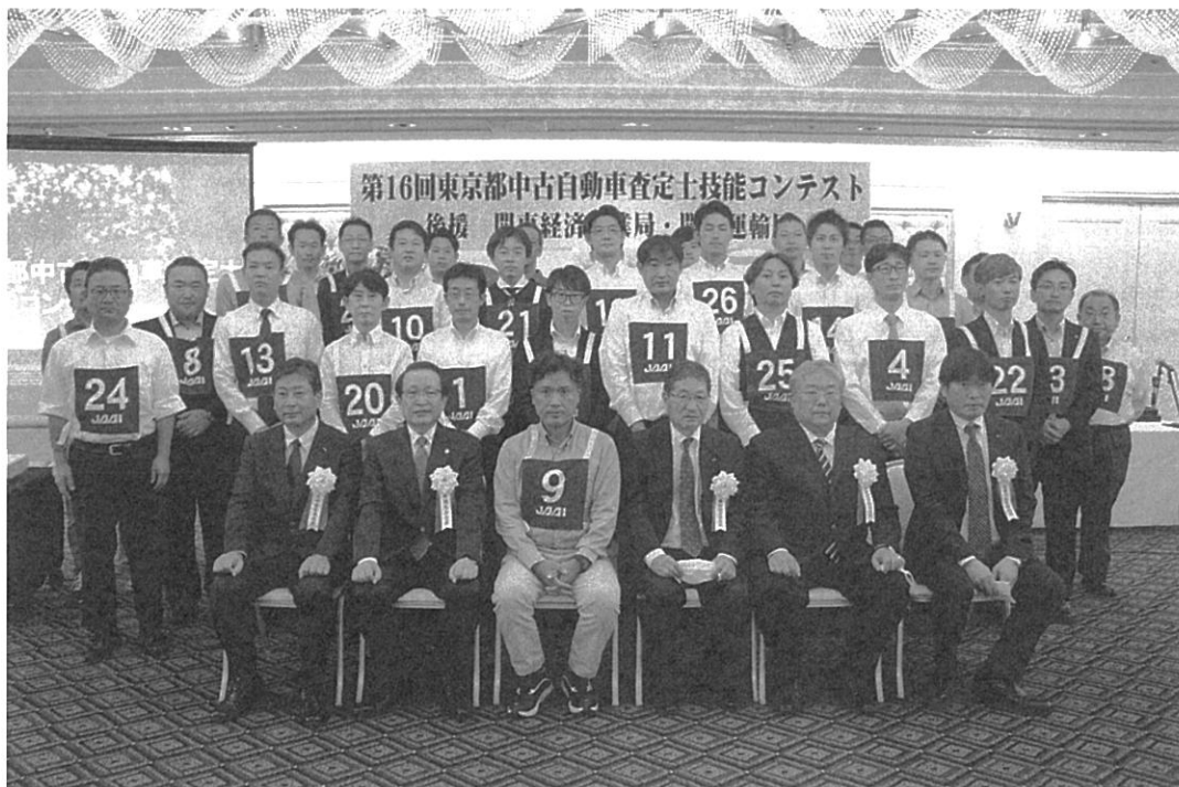
大会役員と出場選手