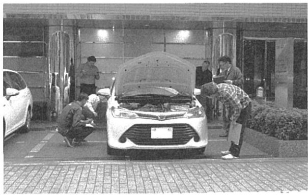
詳細は「教育担当」まで、お問い合わせください。